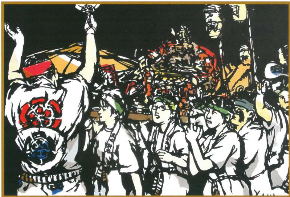
切り絵 比企善彦作