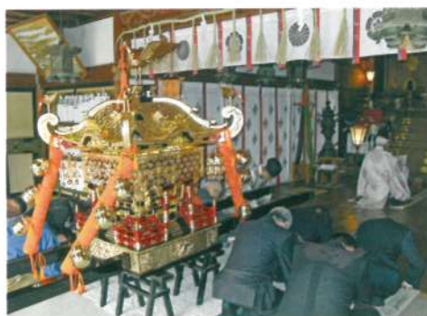
3月23日 神輿奉納報告祭斎行