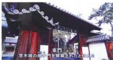
東門 茨木城の搦手門を修築されたといわれる

去る五月四日に放映されたNHK大河ドラマ「軍師官兵衛」で、当社の東門と御本殿が紹介されました。「官兵衛紀行」という本編の後に放映されるコーナーで、その回に本編で登場した茨木城主の中川清秀や有岡城主の荒木村重のゆかりの地として、有岡城跡(伊丹市)とともに、「茨木城跡」の石碑が立つ茨木小学校や、搦手門と伝えられる東門が放映されました。かつての茨木城の裏門にあたり、茨木城は戦国時代に活躍した中川清秀や片桐且元が城主をつとめた城として歴史に名を残しています。残念ながら江戸時代初めの一国一城令