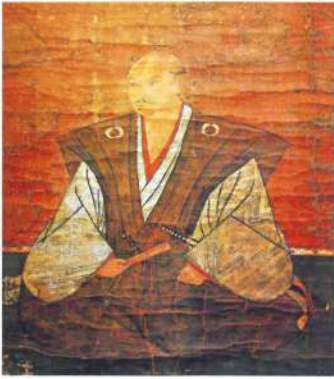
中川清秀像(梅林寺所蔵)

中川清秀は元龜二年（一五七一年）白井河原の合戦で和田惟政を討ち取り、その功により荒木村重によって摂津国新庄一万