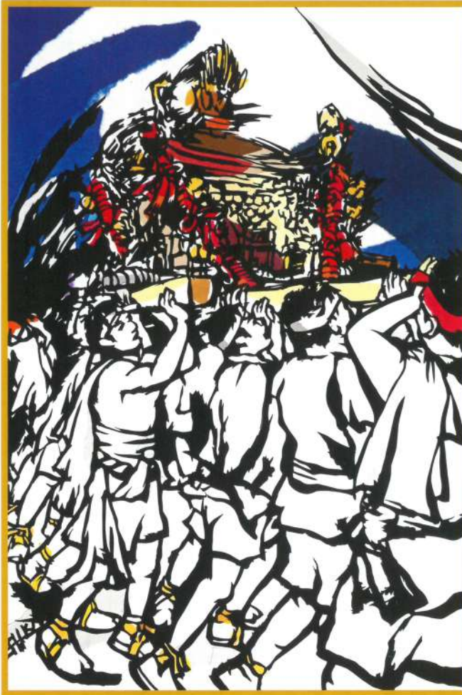
切り絵 比企善彦作